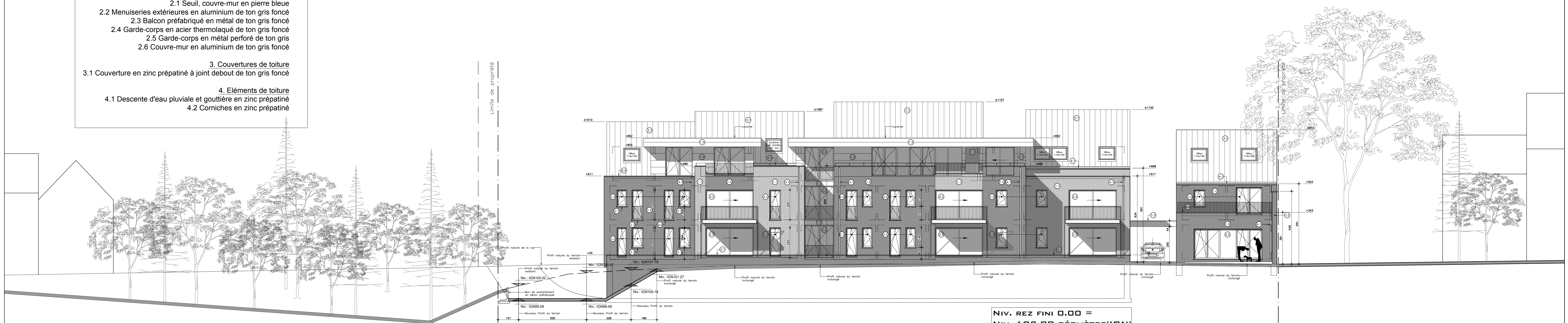
NIV. REZ FINI 0.00 = NIV. 102.00 GÉOMÈTRE(IGN) ÉLÉVATION ARRIÈRE COUPE LONGITUDINALE MODIFICATION DU RELIEF ECHELLE 1:100